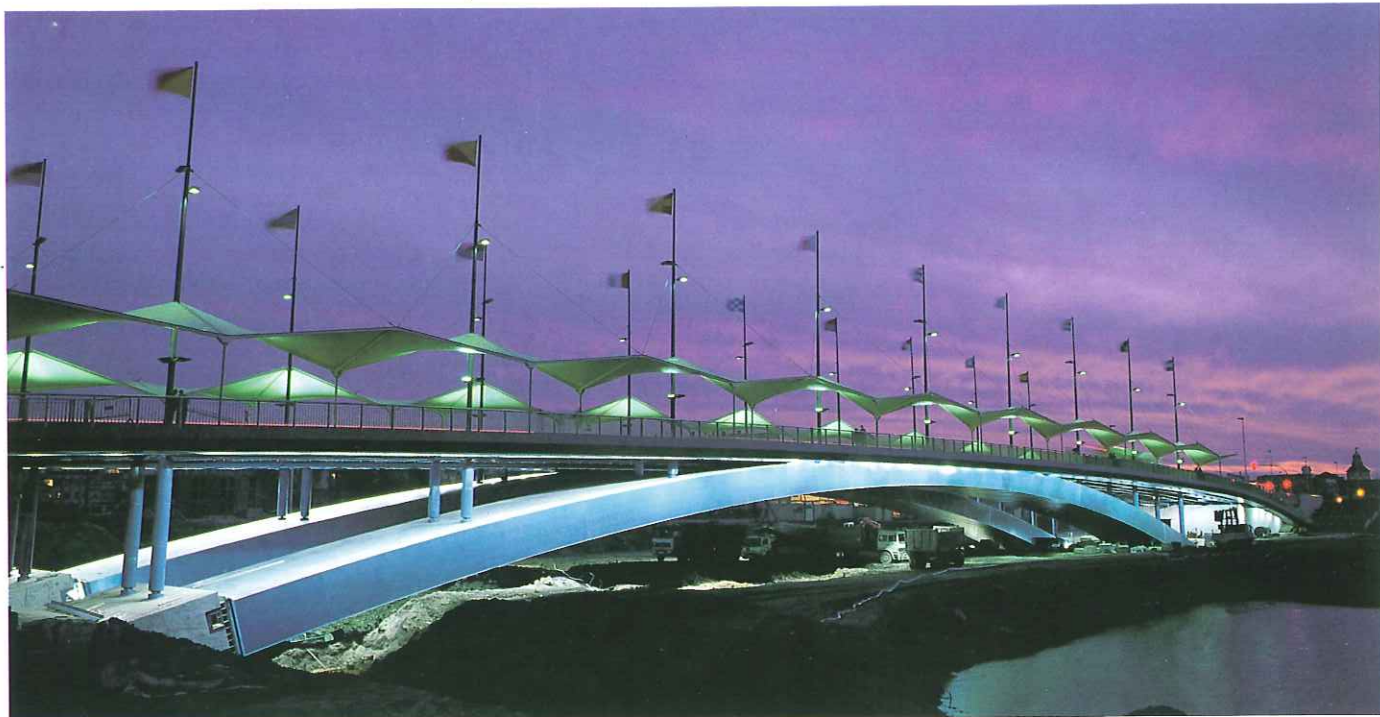
VISTA NOCTURNA DEL PUENTE DEL CACHORRO. EL PLAN ESPECIAL EXPO 92 SE LLEVARA A CABO ANTES Y DURANTE LA MUESTRA.

Este Parque será también la base de otros servicios que abarcan casi todo el término municipal: barrido mecánico de calzadas y aceras, barrido de mantenimiento motorizado, baldeo a alta presión, limpieza de mercados y servicios especiales tales como limpieza de veladas y actos que tienen lugar en la vía pública, intervención rápida, recogida de hoja y de pilas usadas, limpieza del río y de accesos.