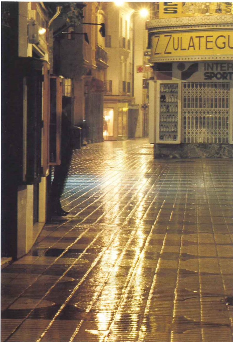
LA AUSENCIA DE RUIDO EN LAS CALLES DE SEVILLA SERÁ ABSOLUTA GRACIAS A LAS NUEVAS BALDEADORAS BIMODALES.

aceite a la altura del puente de Alfonso XIII. Ese día llenamos hasta una docena de bolsas de peces muertos. Actualmente seguimos tratando numerosas manchas de este tipo, y nos cabe la satisfacción de haber recibido una felicitación a través de la Comisaría de la Junta de Obras del Puerto.