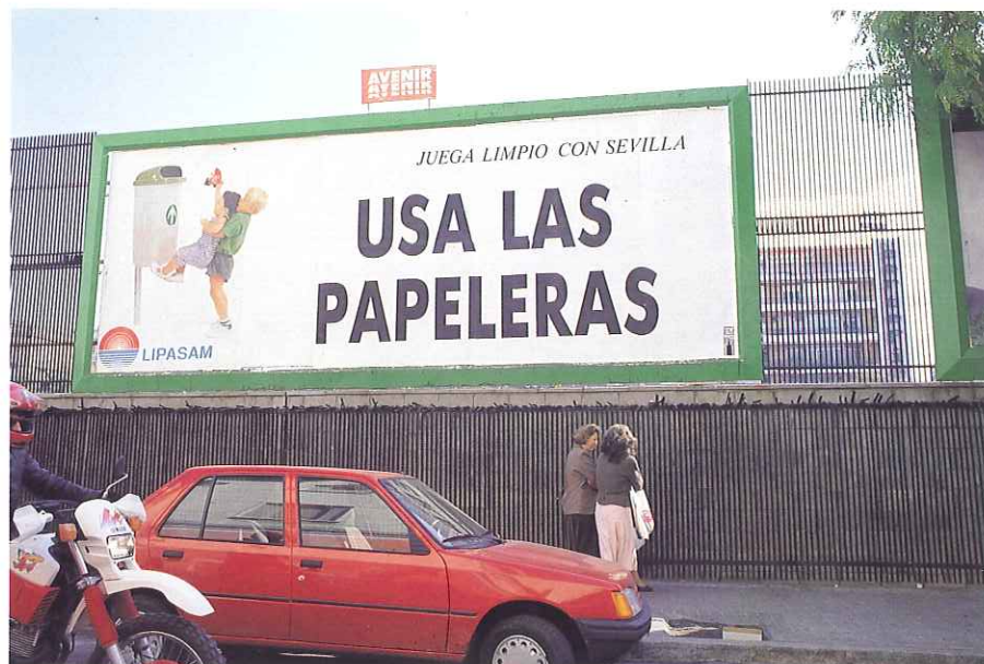
UN MENSAJE CLARO Y DIRECTO SOLICITA A TODOS LOS CIUDADANOS SU COLABORACION EN LA LIMPIEZA DE SEVILLA.

La importancia de esta experiencia formativa, única a nivel de empresa, merece el respaldo y la aprobación de todos.