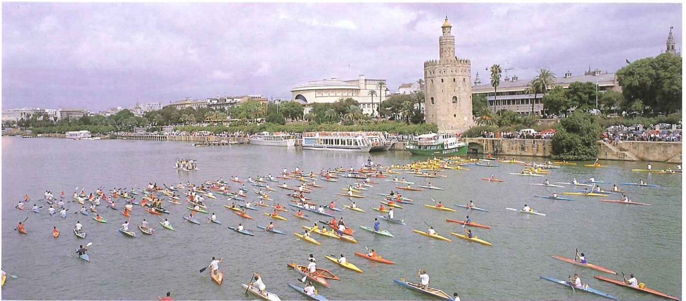
MÁS DE 700 PALISTAS TOMARON PARTE EN LA COMPETICIÓN. EL EQUIPO DE LIPASAM OBTUVO UN MAGNÍFICO QUINTO PUESTO.

con que los sevillanos siguen año tras año esta jornada deportiva, cuyos objetivos son acercar el Guadalquivir al ciudadano, promover la divulgación de mensajes alusivos a la limpieza de Sevilla y fomentar la afición a un deporte cada día más popular.