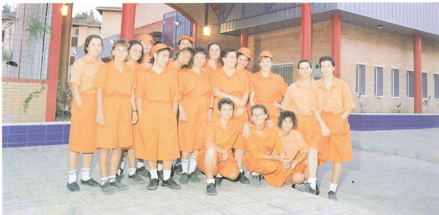
La contratación de mujeres no va a tener carácter esporádico, la plantilla del Parque de Los Principes contará con operarias.