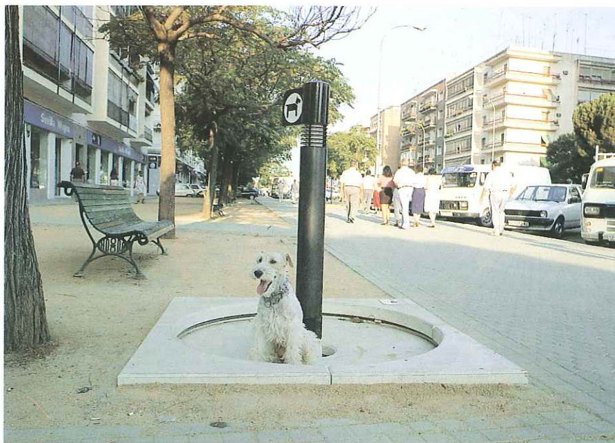
Los Pipi-canes que se están instalando en Sevilla, llevan un sistema de agua corriente.

Una de las más conocidas es la instalación de pipi-canes, de los que existen distintos tipos: de arena,