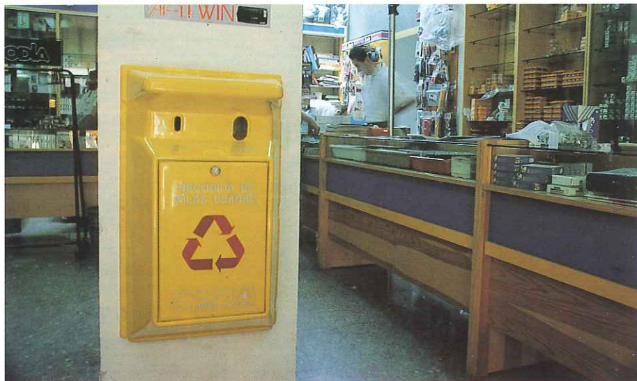
Todas las pilas usadas contaminan, las más peligrosas son las "de botón".

Todas las pilas usadas contaminan, si bien las más peligrosas, son las llamadas de "botón". Cuando estas pilas se agotan y son desecha-