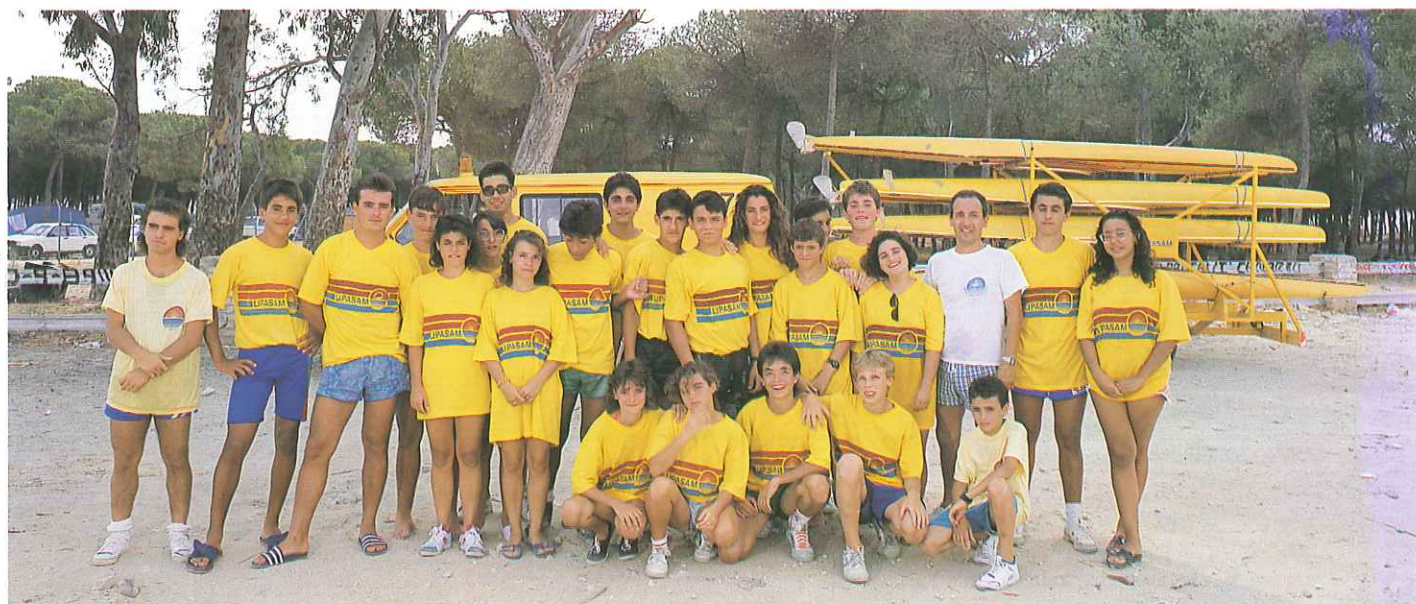
Este año el equipo de LIPASAM participa en la que se considera como la prueba reina de piragüismo en España.

Finalizado el acto se sirvió una copa en un ambiente de gran animación y deportividad.