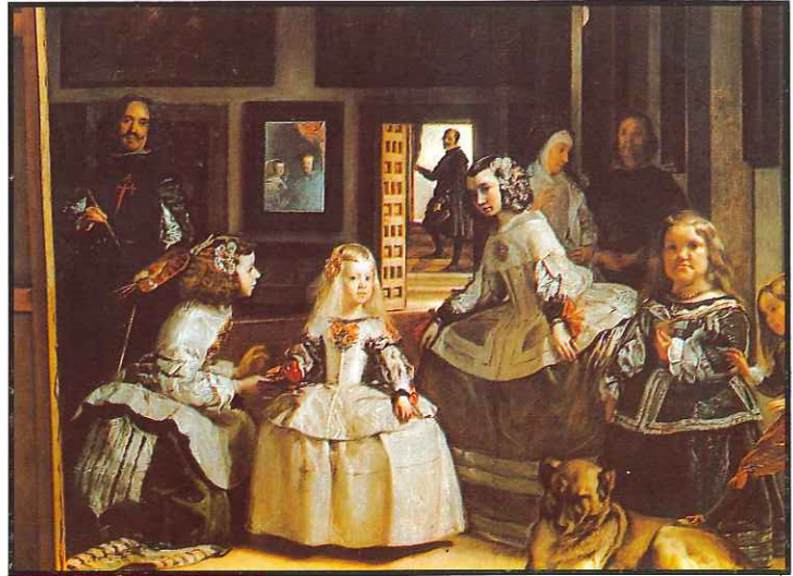
Fragmento de "Las Meninas"

Es por ello que se han realizado unos cursos de primeros auxilios, a los que han asistido casi un centenar de miembros de nuestra plantilla, pertenecientes a Limpieza Viaria Antonia