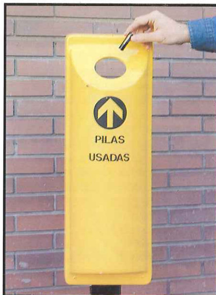
La recogida de pilas evita la contaminación.

¿Cómo lo haríamos mejor? Efectuando una recogida selectiva de las pilas usadas, con lo cual sería posible darles un tratamiento final específico no contaminante.