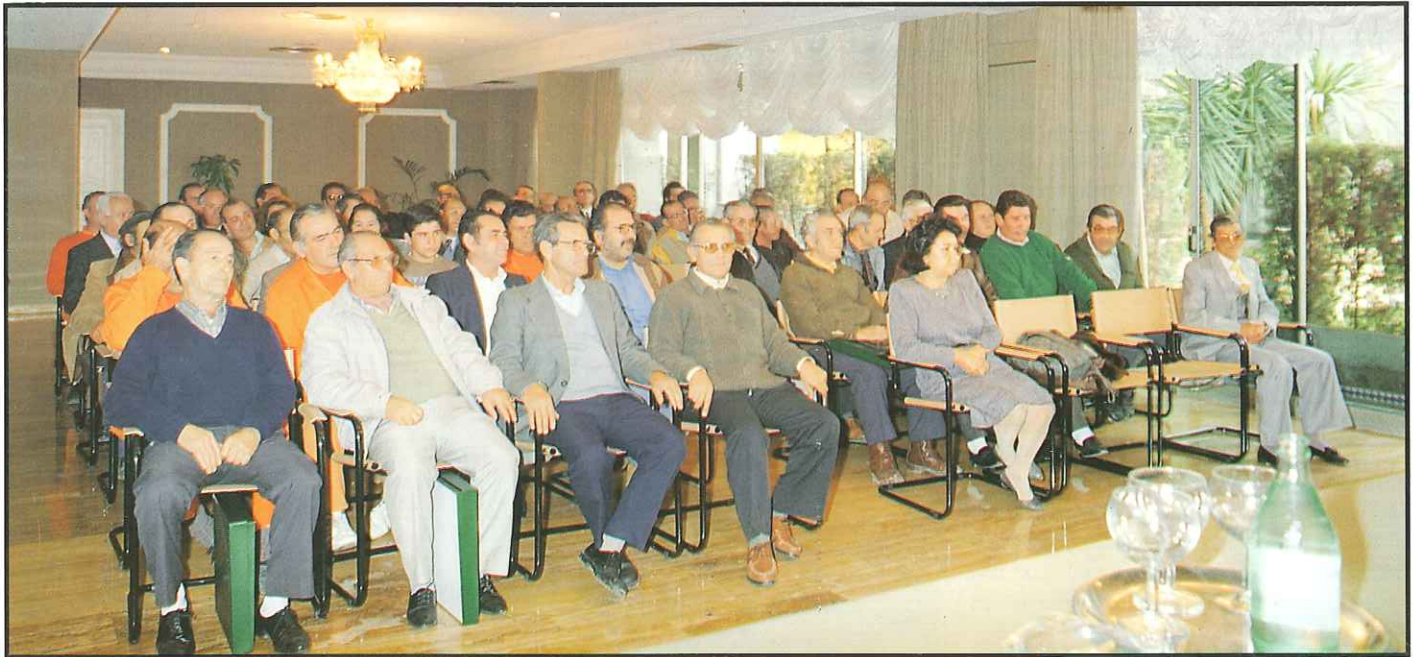
Un momento del emotivo acto celebrado el pasado día 5 de enero, en el que LIPASAM homenajeó a nuestros veteranos compañeros