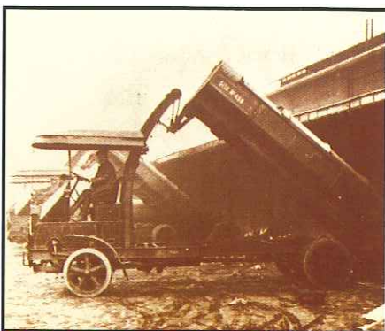
El vehículo era modernísimo para aquella época.

Se están estudiando a fondo estas cuestiones anómalas para ver a qué obedecen y tratar de que su incidencia sea cada vez menor.