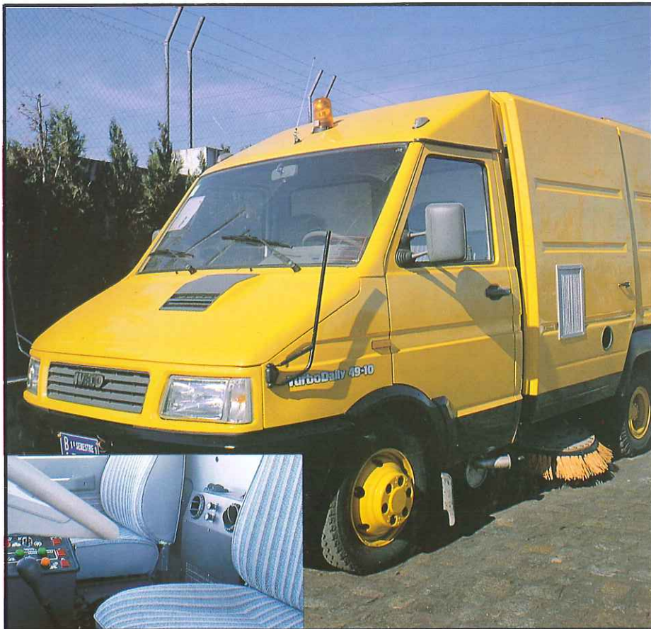
La nueva barredora BR-15, con aire acondicionado.

Ha sido un tropezón serio, que debe hacernos reflexionar a todos y esforzarnos en tomar las medidas tendentes a reducir los índices de absentismo en nuestra empresa, pues en