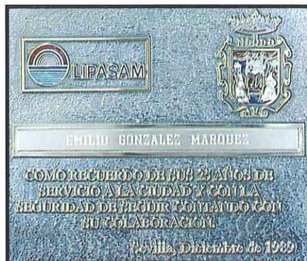
Placa conmemorativa de los 25 años en la empresa.