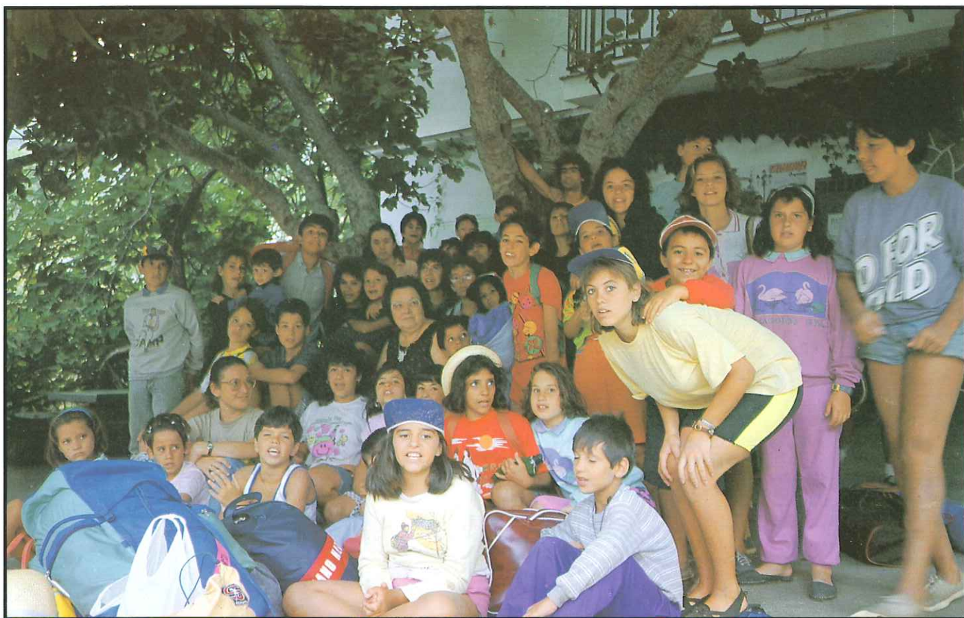
Los campamentos de verano para nuestros hijos han sido un éxito. Este verano habrá más novedades en nuestra casa de Banamahoma.

Revista trimestral de Información y Entretenimiento de LIPASAM. N° 11 Febrero 1990