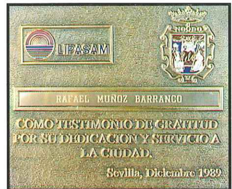
Placa conmemorativa de la jubilación.

● 18 mecánicos recibieron cursos sobre reparación en ROS-ROCA (compactadores de basura) MAYSE (motocicletas y motocicletas) y PEGASO (mecánica en general), sumando 503 horas lectivas.