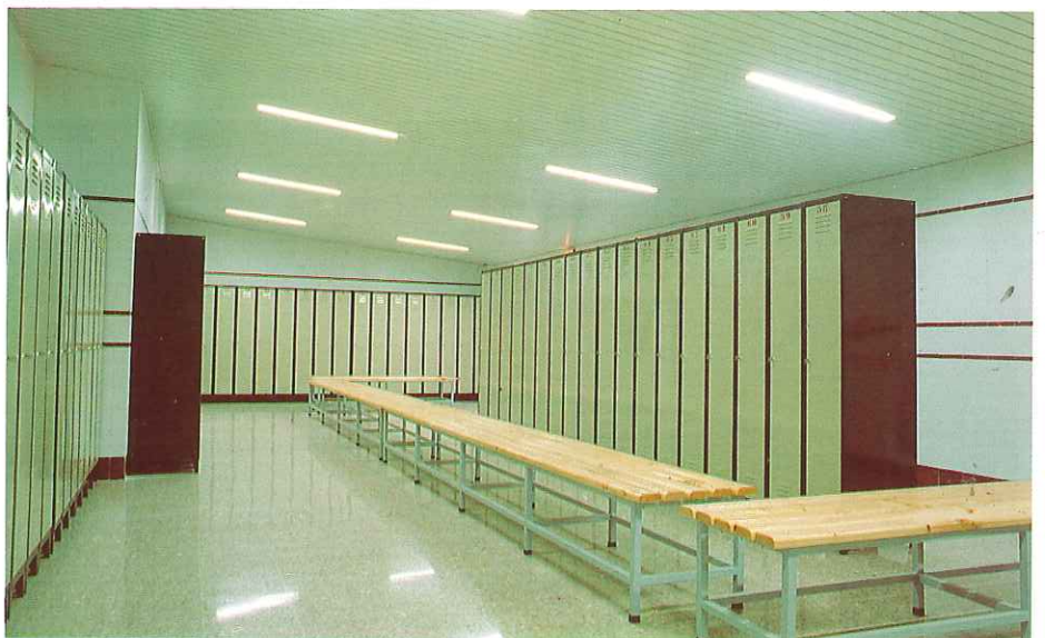
Dos aspectos de los nuevos vestuarios que han entrado en funcionamiento en el Parque Central.