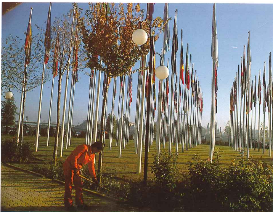
LIPASAM prepara el Proyecto de Recogida de residuos y Limpieza viaria de la Expo 92.

Si nuestro proyecto es aceptado y estos servicios se adjudican a LIPASAM, tendremos frente a nosotros un gran reto que afrontaremos con la máxima ilusión.