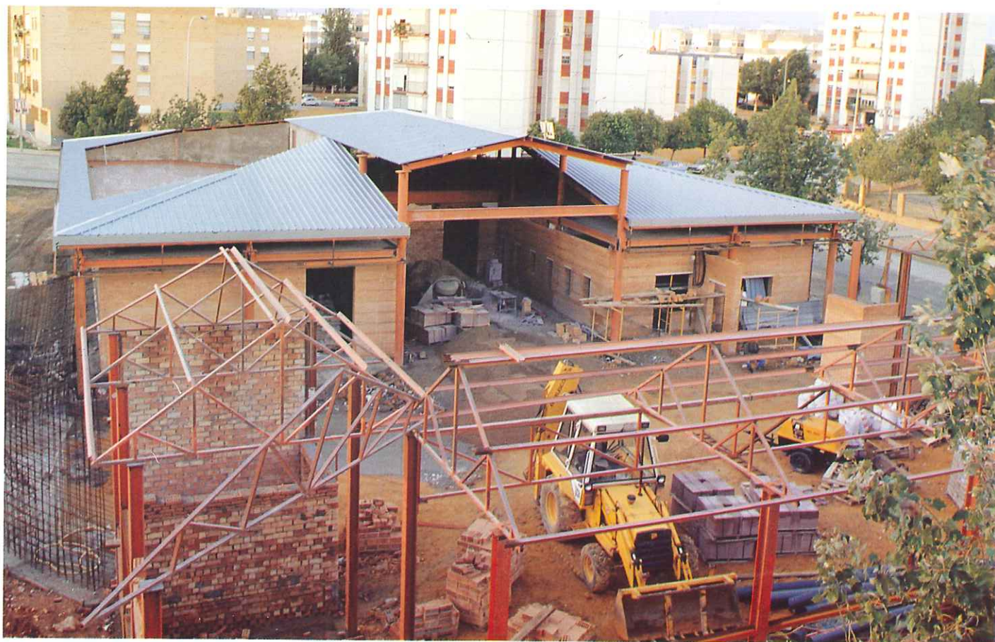
Las obras del nuevo Parque Sur están casi terminadas y el resultado podemos calificarlo como de muy satisfactorio.

Revista trimestral de Información y Entretenimiento de LIPASAM, Nº 10 Noviembre 1989