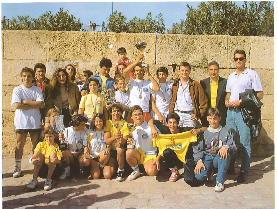
Nuestros palistas muestran los trofeos que obtuvieron en la Fiesta de la Piragua.

En este trimestre debemos felicitarnos porque el absentismo ha sido del 7,8%, lo que significa una nueva bajada respecto del trimestre anterior, en que se registró un 8,32%. La aportación de la Empresa al Fondo de Asistencia al Trabajo alcanzará la cifra de 1.750.000 pesetas. Han sido 836 los empleados que durante este trimestre no han faltado al trabajo, correspondiéndoles a cada uno 3.228 pesetas, con lo cual ya llevan acumulado un premio de 14.636 pesetas. Vamos a seguir esforzándonos en reducir todavía más el absentismo hasta llevarlo a los niveles normales, a los que nos vamos acercando pero aún no hemos conseguido alcanzar.