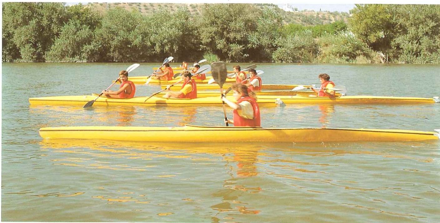
El equipo de piragüismo de LIPASAM se ha revelado como cantera de estupendos deportistas, que han competido con los clubs tradicionales de Sevilla.

defender el medio ambiente urbano, así como una sólida base legal para el eficaz funcionamiento de nuestro servicio de Inspección.