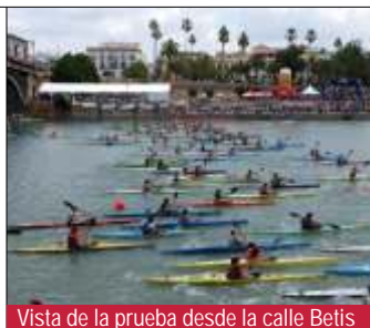
Vista de la prueba desde la calle Betis

En esta vigésima edición han participado más de 30 clubes procedentes de toda España con más 450 embarcaciones en competición.