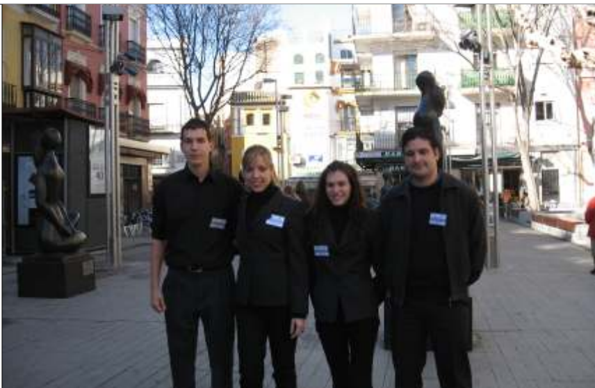
Equipo que colaboro en la campaña informativa "puerta a puerta"

En el caso de nuestra ciudad, el sistema convivirá con la Recogida Neumática de Residuos implantada en el Barrio de Santa Cruz y el