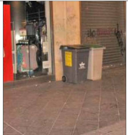
Cubos en el Casco Antiguo, en calle peatonal

En estos tres sectores ya ha finalizado la entrega de los cubos, con gran aceptación por parte de los residentes y comerciantes, y el sistema está funcionando con toda normalidad. En estos momentos se está informando al entorno de la Plaza de la Alfalfa para finalizar la implantación de mencionado sistema.