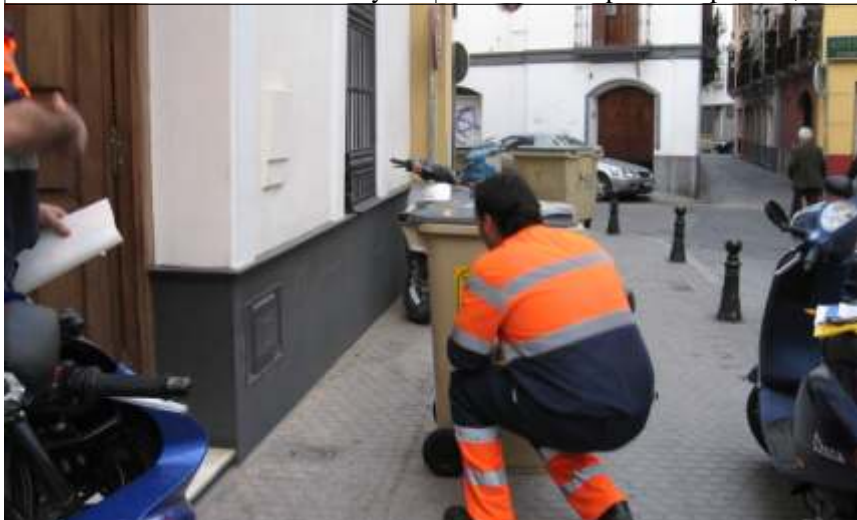
Un operario de Lipasam coloca el adhesivo indentificativo, en un cubo, antes de su entrega

La realización del Plan se inició en enero pasado en la zona denominada Piel sensible, en el entorno de la Plaza de la Alfalfa, y concretamente en las calles San Isidoro-Cabeza del Rey Don Pedro-Descalzos- >>