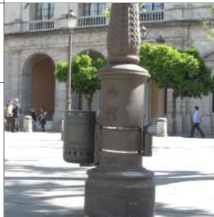
Cenicero en la Plaza Nueva

El modelo de cenicero, que se ha instalado, tiene forma cilíndrica y color gris oscuro, del mismo tono al de las papeleras y farolas, produciendo un escaso impacto visual. Por otro lado, se asocia rápidamente su aspecto con la función para la que ha sido diseñado. Se trata de llamar la atención de los fumadores, y sensibilizarlos sobre el problema que representan las numerosas colillas que son