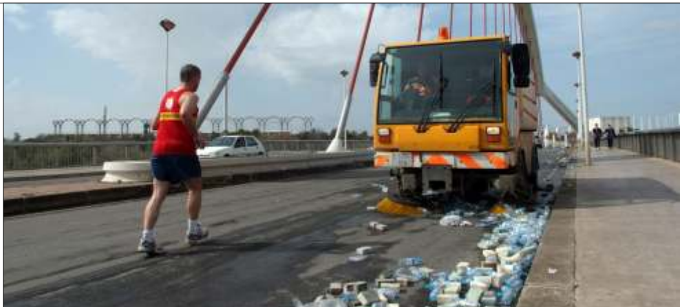
Maratón Ciudad de Sevilla

Las acciones más destacables de la “Brigada de Grandes Eventos” desde su creación, han sido el seguimiento a la maratón, a la Fiesta de la Piragua Ciudad de Sevilla y a los encuentros deportivos de los equipos sevillano (Sevilla, Betis y Cajasol).