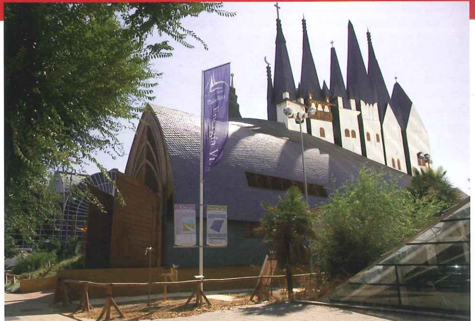
El Pabellón de la Energía Viva será la sede del nuevo circuito medioambiental.

El circuito, que se pondrá en marcha durante el mes de octubre, estará integrado por tres Rutas, la del Agua, la del Transporte Público y la de los Residuos Urbanos, rutas que los asistentes recorrerán acompañados de