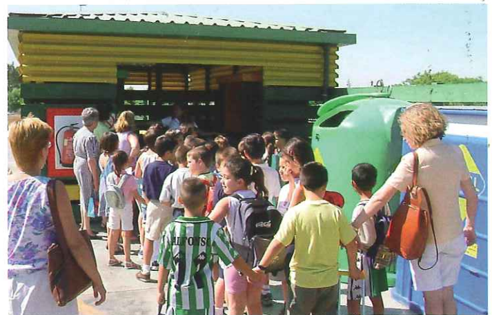
Las Centrales de Recogida Neumática y los Puntos Limpios formarán parte del nuevo Circuito Medioambiental.