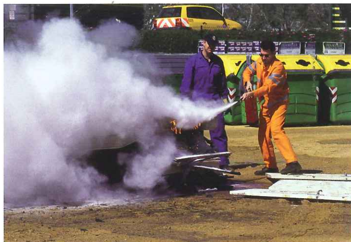
Un empleado participa en el curso de extinción de incendios.

Próximamente se publicará amplia información sobre el mismo y los empleados a los que afectará esta nueva oferta formativa.