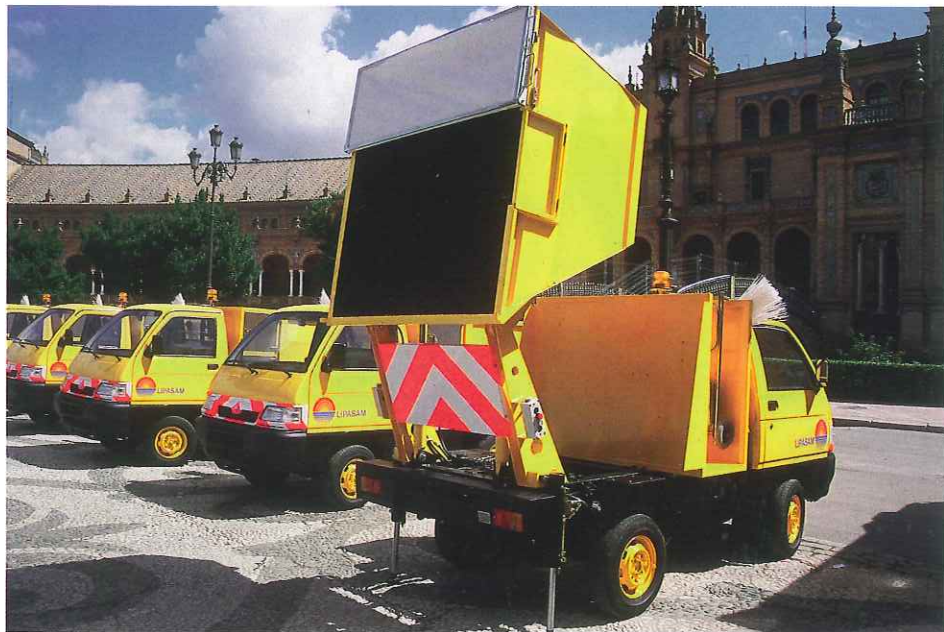
Treinta nuevas unidades se incorporarán a la flota de motocarros biplaza.

Por otra parte, la entrada en servicio de nuevas instalaciones y la remodelación de los Servicios de Limpieza, con un mayor grado de mecanización, requerirán de forma inmediata la incorporación de este