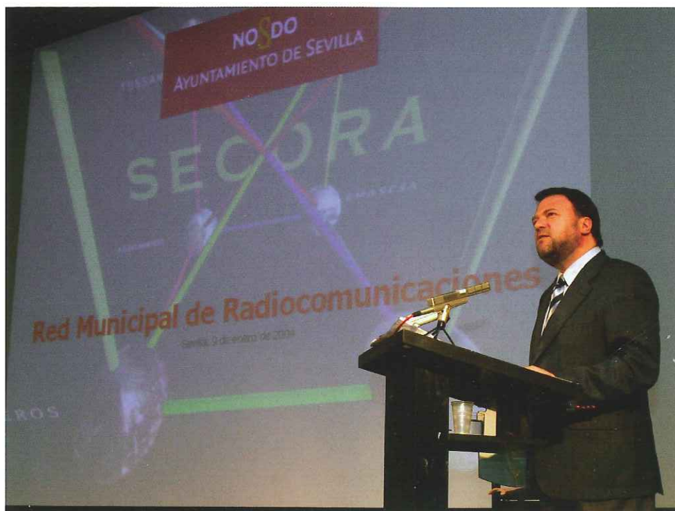
El Alcalde de Sevilla durante la presentación del proyecto SECORA.

Dentro del marco de la Agrupación de Interés Económico de Empresas Municipales de Sevilla (AIE), de la que LIPASAM forma parte, se van a acometer una serie de proyectos relacionados con las nuevas tecnologías y que nos van a permitir seguir manteniéndonos en vanguardia. Conoce las líneas generales de los mismos: