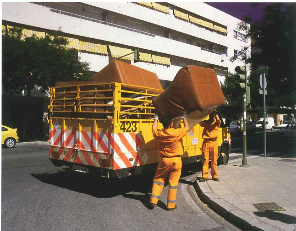
La Recogida de Muebles y Enseres es el servicio más solicitado por los ciudadanos a través del Teléfono de la Limpieza.

Desde que en 2.001 este servicio pasó a prestarse veinticuatro horas al día siendo atendidas todas las llamadas directamente por operadoras, el número de llamadas recibidas ha ido creciendo de forma continuada hasta situarse por encima de 62.000 llamadas al año y con la previsión de superar las 70.000 a lo largo de 2.004.