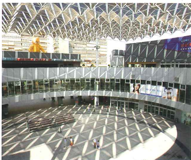
La Semana del Medio Ambiente tendrá lugar en un importante centro comercial.

Durante esos días, el Centro Comercial será escenario de distintas actividades como Pasacalles, Cuenta-cuentos, Juegos y Talleres, todas ellas dirigidas a los más pequeños, con el objetivo de crear en ellos el hábito de la separación de los distintos residuos domésticos para facilitar su posterior reciclaje.