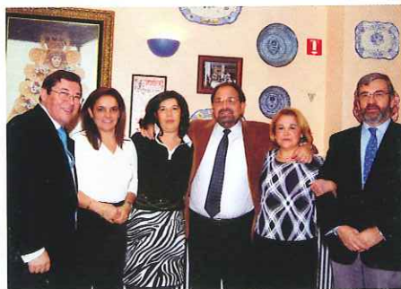
Primeras mujeres jubiladas junto al gerente y directivos.