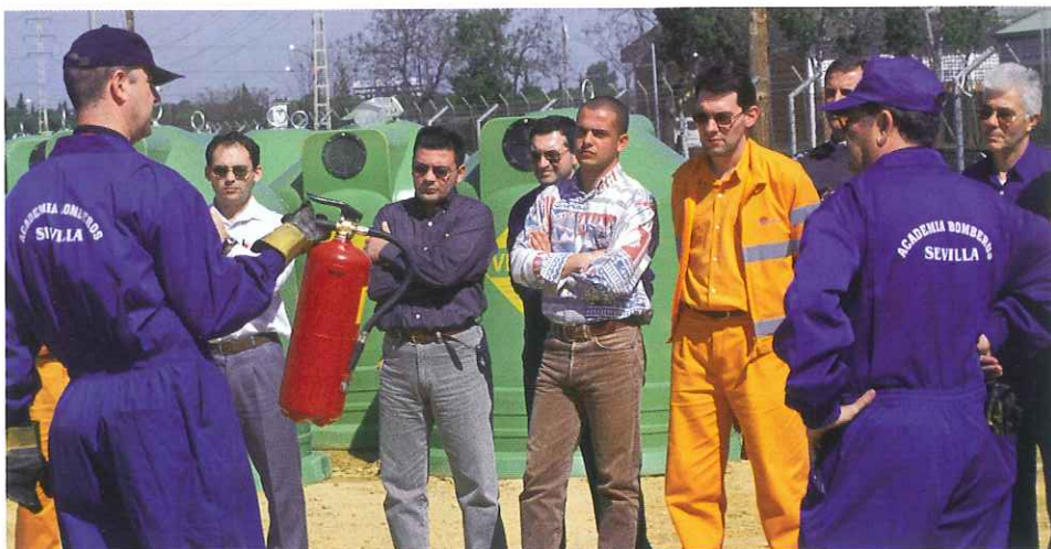
La Formación mejora nuestra seguridad.

Una buena formación te permite ampliar tus conocimientos y el nivel de seguridad en tu trabajo. En definitiva es la base de la superación personal, y además redundará finalmente en la prestación de mejores servicios a los ciudadanos.