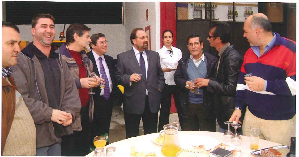
Director Gerente, Director Recursos Humanos, representantes sindicales y otros compañeros departiendo amigablemente.

En cada uno de los Centros de Trabajo en que se han celebrado los actos, el Director Gerente de LIPASAM dirigió unas palabras de saludo y felicitación a todos los empleados.