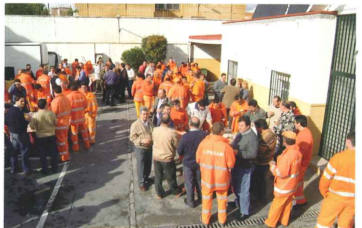
Vista general en el Parque Auxiliar San Pablo.