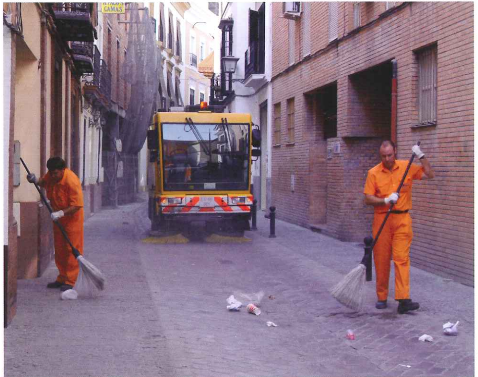
El Barrido Mecanizado permite conseguir un mayor rendimiento y calidad del servicio.

Entre sus características, destaca la incorporación de motores que cumplen las especificaciones de la Norma Euro III garantizando un bajo nivel de emisiones gaseosas contaminantes. Cuidar estos vehículos y utilizarlos con profesionalidad, además de ser una responsabilidad de todos redundará en la mejora de los servicios que prestamos a los ciudadanos.