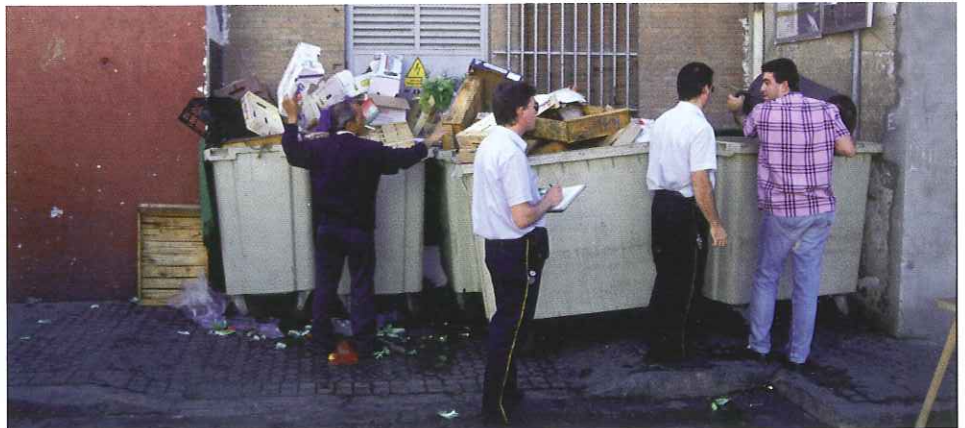
Las infracciones en relación con la recogida de residuos son las más habituales.

El motivo principal de estas sanciones fueron las infracciones de la Ordenanza en relación con la Recogida de Residuos, iniciándose más de mil procedimientos, lo que supone un 41 % del total. En relación con los años anteriores, y en cuanto al tipo de sanción, se ha registrado un incremento de las infracciones en materia de limpieza y recogida, mientras que disminuyeron las relativas a obras, vertidos y publicidad.