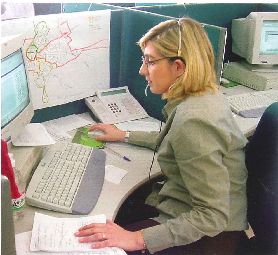
El Teléfono de la limpieza 24 horas al día al servicio del ciudadano.

A continuación y por orden de importancia, se situaron las llamadas con solicitud de información general, seguidas de las solicitudes de prestación de diferentes servicios de limpieza viaria.