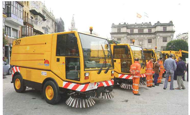
Las nuevas barredoras permitirán mejorar la calidad de los servicios.