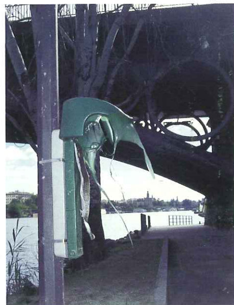
Estado de una papeleras tras sufrir un acto vandálico.

Por ello es importante que cuando observemos alguna incidencia que afecte a un contenedor o papeleras, informemos de ello al mando intermedio que nos corresponda.