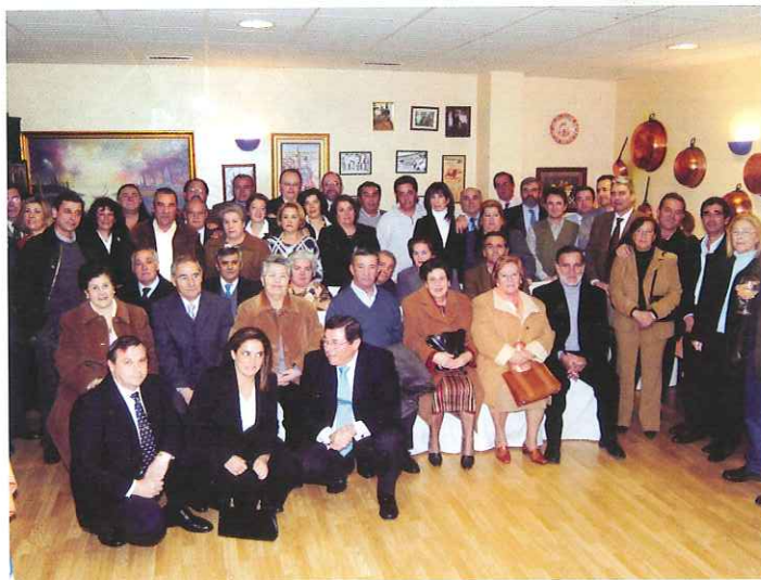
Los homenajeados "posan" junto a familiares y directivos de LIPASAM.

Desde estas páginas queremos agradecer a todos su esfuerzo y su dedicación durante tantos años, que constituye un ejemplo para todos y un aliciente para mejorar día a día en el servicio a los sevillanos