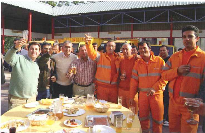
Reunión en Parque Sur: alegría, felicidad, buen ambiente, sintonía.

un gratísimo ambiente que esperamos se mantenga durante todo el año en el desarrollo de nuestro trabajo.