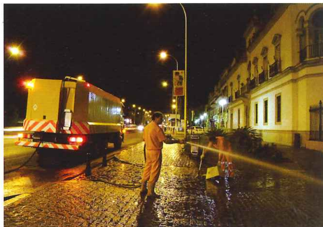
Más Baldeo en el Casco Histórico de Sevilla.

En cuanto al equipo humano, la dotación total destinada a las distintas