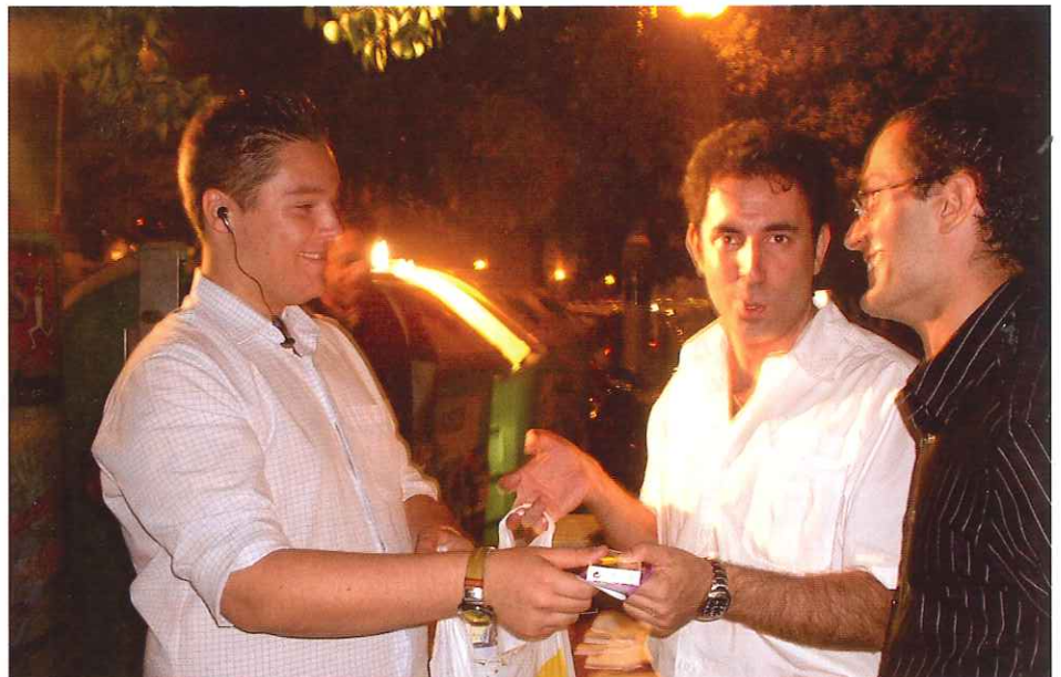
Jóvenes colaborando en la campaña.