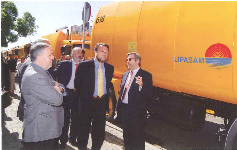
El Alcalde de Sevilla recibe las explicaciones del Director Gerente de LIPASAM.

La llegada de veintiocho nuevas Baldeadoras permitirá doblar la frecuencia de actuación en toda la ciudad