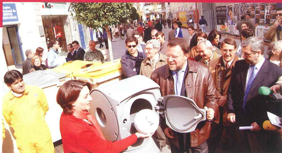
El Alcalde de Sevilla durante la presentación del nuevo sistema.

Las obras para la implantación del Sistema Móvil de Recogida Neumática en el Casco Antiguo llevan implícitas una inversión de 3,61 millones de euros, y afectarán de forma positiva a 5.500 habitantes de la zona y a 250 establecimientos comerciales cuando esté totalmente finalizado. El Mecanismo Financiero del Espacio Económico Europeo aporta el 70 % de la inversión prevista, corriendo el 30 % restante a cargo del Excelentísimo Ayuntamiento de Sevilla.