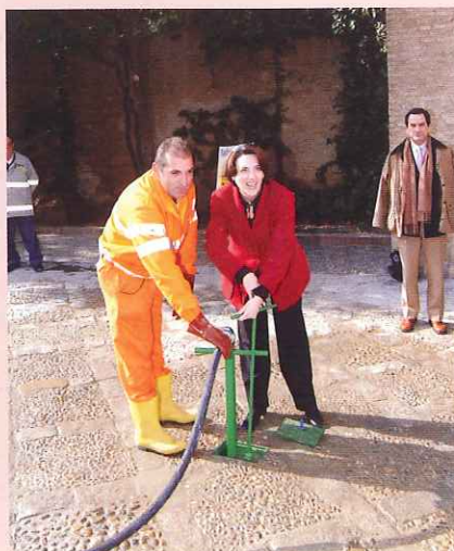
La Delegada de Medio Ambiente, Evangelina Naranjo, inaugura la nueva red.

Estas incorporaciones permitirán aumentar de forma notable la calidad del servicio de limpieza viaria en dicho barrio y mejorará el nivel de confort de los residentes, dado que suprime el empleo de equipos mecanizados, eliminando las emisiones contaminantes y disminuyendo enormemente el nivel de ruidos.