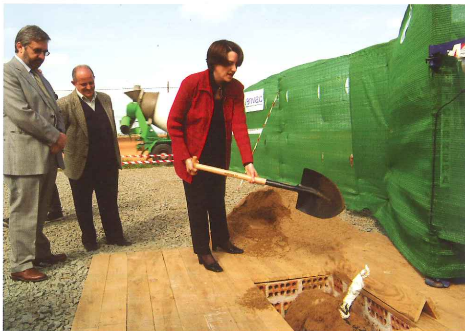
Momento del acto de colocación de la primera piedra.

El nuevo Punto Limpio ocupará una superficie total de 4.775 metros cuadrados, con una superficie cubierta de 40 metros cuadrados, que corresponden básicamente a las dependencias que albergan las