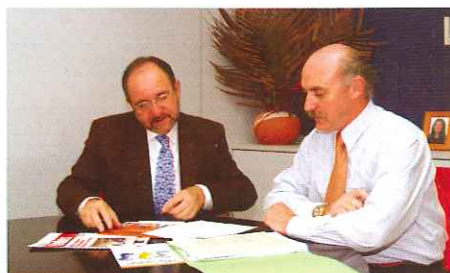
Sesión de trabajo en el Departamento.