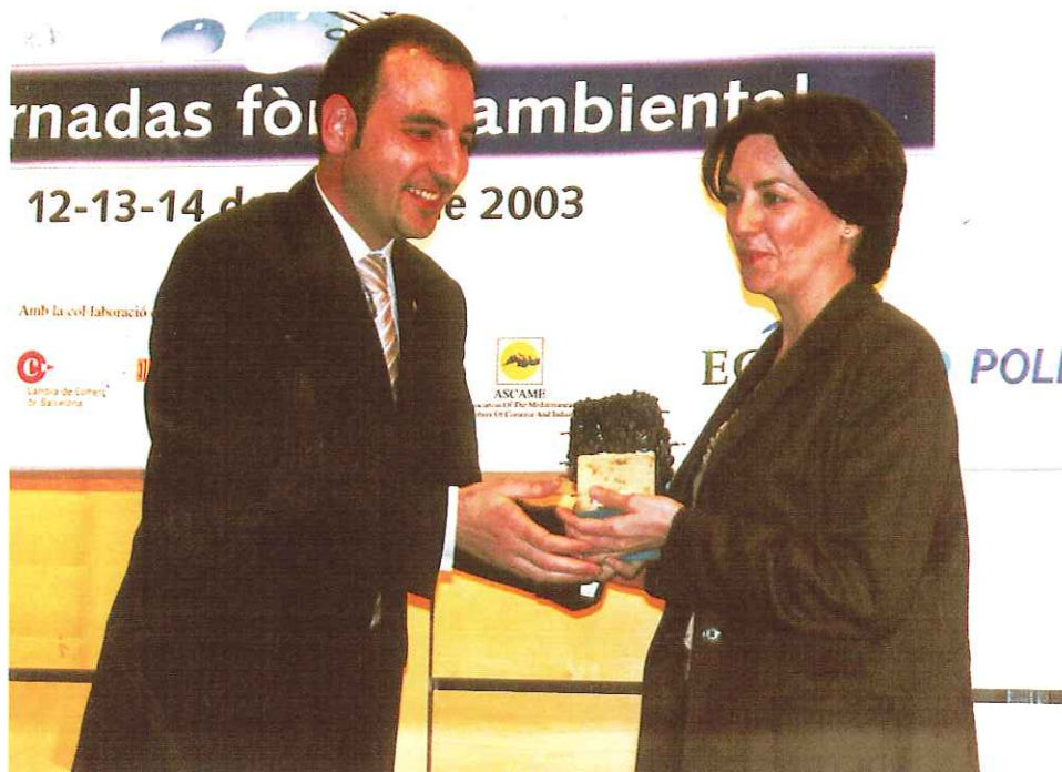
La Delegada de Medio Ambiente y Presidenta de LIPASAM recoge el Premio Ecomed.

El Ayuntamiento de Sevilla ha sido galardonado con el Premio Ecomed a la ciudad más sostenible en el ámbito de la gestión de residuos, concedido por la Fundación Fórum Ambiental en el marco de ECOMED POLLUTEC, Salón Internacional de la Energía y del Medio Ambiente, organizado por Fira de Barcelona.