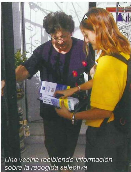
Una vecina recibiendo información sobre la recogida selectiva

Cuatro son los grandes grupos en los que se dividen los residuos según su