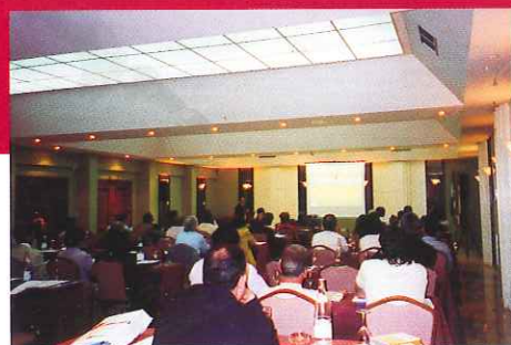
Una de las sesiones de la jornada