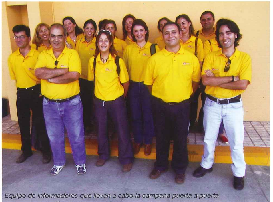
Equipo de informadores que llevan a cabo la campaña puerta a puerta

naturaleza: envases, orgánicos, papel-cartón y vidrio; sin olvidarnos de los residuos peligroso y especiales. A los ciudadanos se les informa sobre los distintos contenedores que tienen a su disposición: el de tapa amarilla para depositar envases ligeros (plástico, metal, envases tipo brik), el de tapa verde o gris para restos orgánicos, el verde en forma de iglú para vidrio (botellas, botes, tarros y frascos sin tapas ni taponos) y el azul donde se debe depositar papel y cartón. En establecimientos comerciales y tiendas especializadas podemos encontrar contenedores específicos para pilas, al igual que los medicamentos usados los podemos reciclar en contenedores habilitados en muchas farmacias.