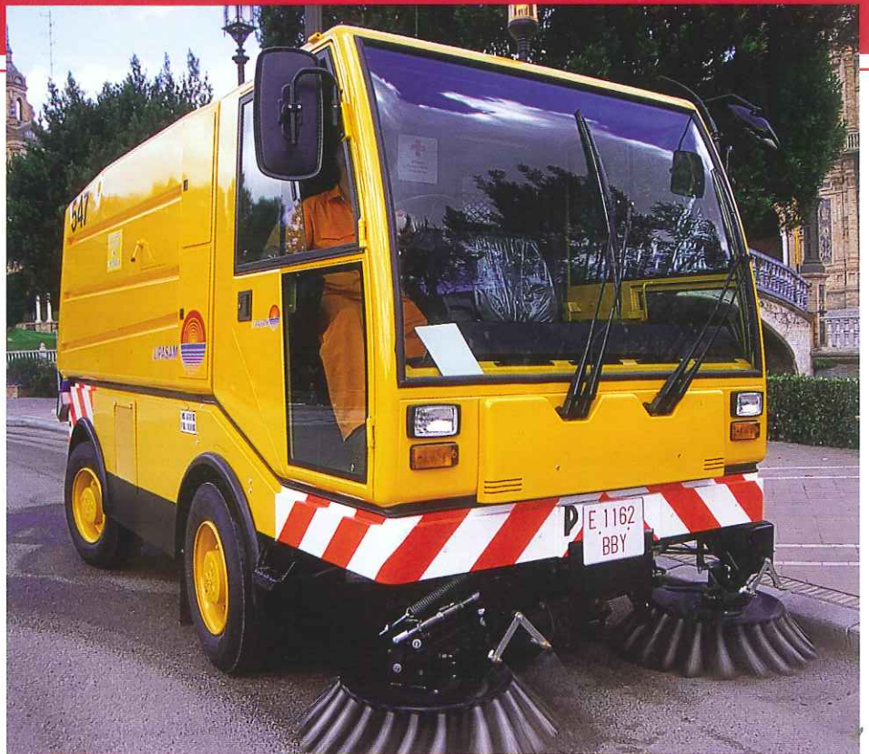
Uno de los vehículos que formarán parte del equipo del barrido mixto

Basándose en estos estudios, LIPASAM ha puesto en marcha un ambicioso proyecto que contempla la implantación del barrido mixto, que se llevará a cabo mediante la actuación de nuevos equipos de trabajo formados por un conductor y dos o tres operarios dotados de escobas, cepillos o