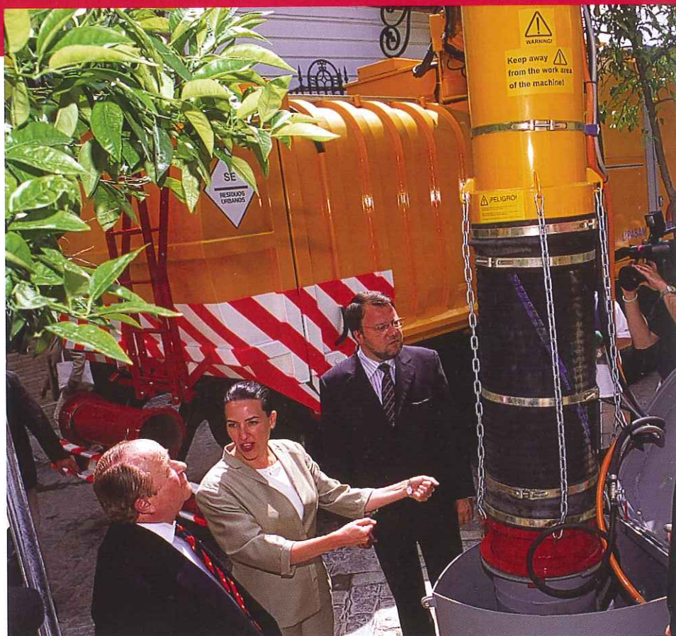
El alcalde, la delegada de Medioambiente y el presidente de la A.VV. del barrio de Santa Cruz, durante la inauguración del nuevo sistema

Una de las muchas ventajas del Sistema es su comodidad y limpieza. La bolsas bien cerradas se introducen por la escotilla, tan sólo hay que accionar una palanca y depositar la basura dentro del buzón. Se consigue así cuidar más aún una de las joyas de la ciudad, el barrio de Santa Cruz eliminando contenedores, restos de basura, ruidos y malos olores.