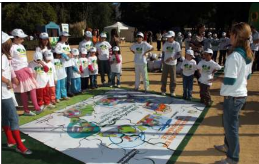
Los más pequeños, protagonistas de Reciclavidrio en Ruta

Desde que se puso en marcha esta iniciativa, se han recogido de forma selectiva 65.000 toneladas de envases, cuya recuperación y reciclaje supone el ahorro de más de 78.000 toneladas de materias primas,