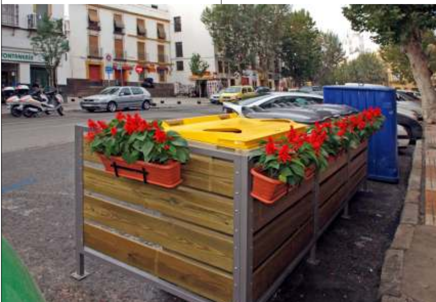
El nuevo modelo de cerramiento-embellecedor instalado en la C/ Adriano

La puesta en marcha de esta y otras iniciativas, junto con la colaboración de los ciudadanos, usando correctamente los contenedores y respetando el horario para depositar los residuos, contribuirá con toda seguridad al mantenimiento de una ciudad más limpia, saludable y respetuosa con el Medio Ambiente, objetivos prioritarios para LIPASAM.