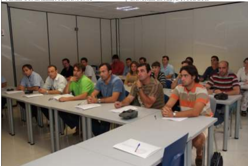
Participantes en uno de los cursos