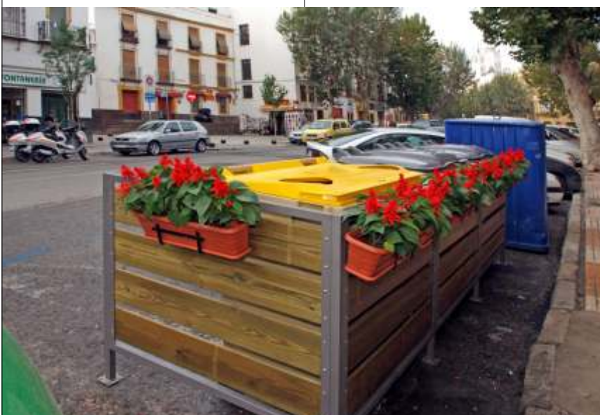
El nuevo modelo de cerramiento-embellecedor instalado en la C/ Adriano

La puesta en marcha de esta y otras iniciativas, junto con la colaboración de los ciudadanos, usando correctamente los contenedores y respetando el horario para depositar los residuos, contribuirá con toda seguridad al mantenimiento de una ciudad más limpia, saludable y respetuosa con el Medio Ambiente, objetivos prioritarios para LIPASAM.