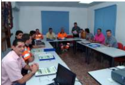
Curso en Parque Central