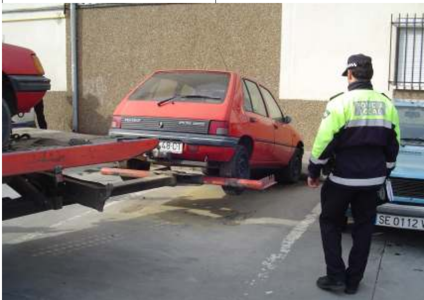
La Policía Local, procede a la retirada de un vehículo abandonado, en colaboración con LIPASAM

Por otra parte cabe destacar que la OVA retirará los contenedores de obras ilegales o que no cumplan con las Ordenanzas Municipales.