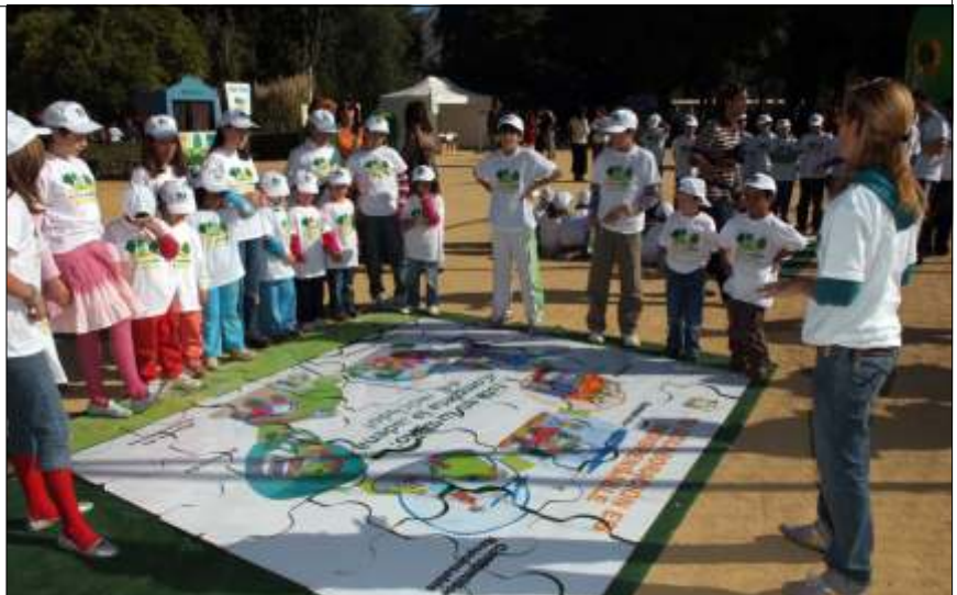
Los más pequeños, protagonistas de Reciclavidrio en Ruta

Desde que se puso en marcha esta iniciativa, se han recogido de forma selectiva 65.000 toneladas de envases, cuya recuperación y reciclaje supone el ahorro de más de 78.000 toneladas de materias primas,