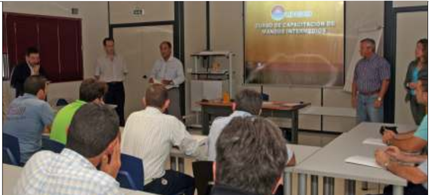
Curso de capacitación de Mandos Intermedios