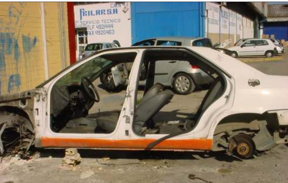
Ejemplo de vehículo abandonado que deteriora la imagen y limpieza de la ciudad

La puesta en marcha de este nuevo servicio ha permitido abordar la problemática que supone la gran cantidad de vehículos abandonados en las calles y que, además de ofrecer una imagen negativa, constituyen un foco de suciedad, debido a los residuos que se depositan tanto en el interior de los vehículos como bajo los mismos. Además son usados por indigentes como vivienda, por toxicómanos, e incluso por la prostitución, generando el rechazo de los ciudadanos, que venían requiriendo al Ayuntamiento