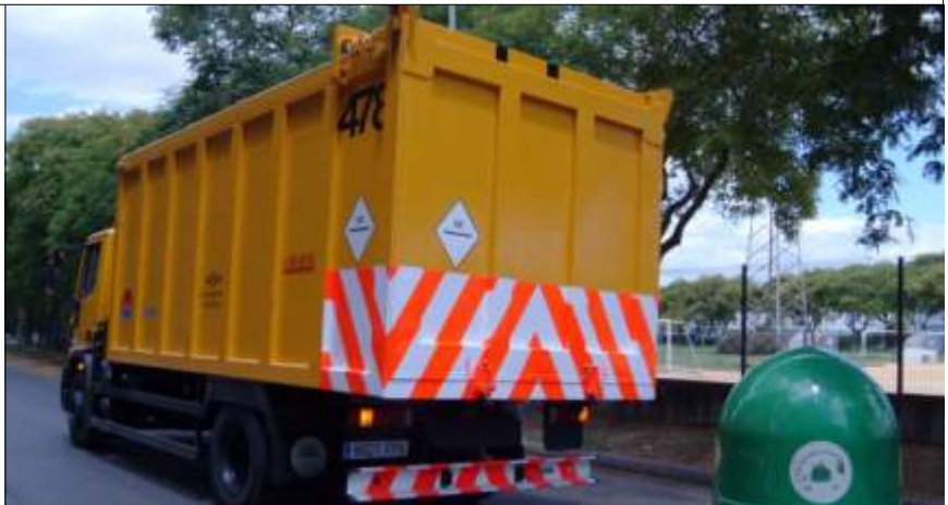
Mantén el régimen del motor entre 1.500 y 2.500 revoluciones.

estén dentro de las revoluciones mínimas. Así el consumo de carburante será menor.